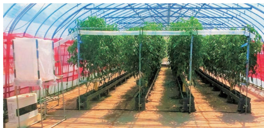
「小型炭酸ガス発生機」を利用したピーマン栽培