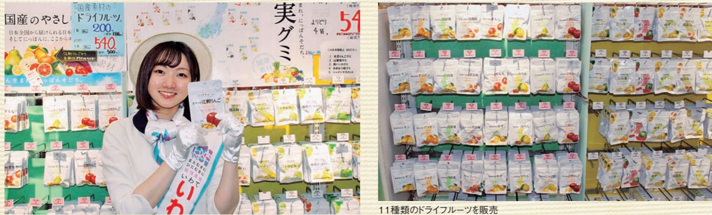
11種類のドライフルーツを販売

岩手県からは、江刺産「サンふじ」を使用したやさしい味わいの「江刺りんごドライフルーツ」が発売されています。その他にも和歌山県産「南高梅ドライフルーツ」や熊本県産「デコポンドドライフルーツ」など全国各地から11種類のドライフルーツを販売しています。全国ご当地グミも引き続き販売しておりますので、ぜひ「純情ショップ」に足をお運びください。