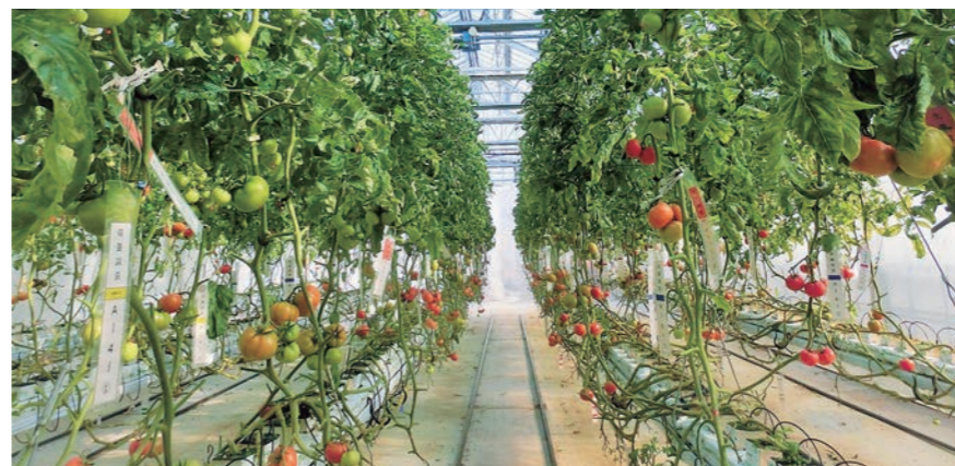
「FARMATE」を利用したトマト栽培

一方、本県では小規模の単棟ハウスでの生産が中心であり、複合環境制御技術導入へのステップアップ技術が必要と考え、岩手農研セと県内企業との共同研究により商品化された60x100坪のパイプハウスに適した小型炭酸ガス発生機を用い、雨よけ夏秋栽培のピーマンやミニトマトなどを対象に穴あきダクトを通して群落内に