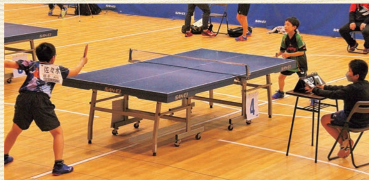
白熱した試合が繰り広げられました

JA全農が協賛する「全農杯全日本卓球選手権」の岩手県予選会が、令和4年4月29日(金)に花巻市民体育館で開催されました。予選会には101名の選手が出場。小学6年生以下(ホープス)、小学4年生以下(カブ)、小学2年生以下(バンビ)の部に分かれ、全国大会を目指して熱戦が繰り広げられました。