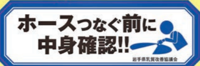
異物混入防止ステッカー

また、生乳は集乳の段階で他生産者の生乳と合乳になります。日々の生産管理はもちろん、被害を最小限に抑えるためにも、何か異変に気付いた際は、集乳前に農協や本会へご連絡をお願いいたします。