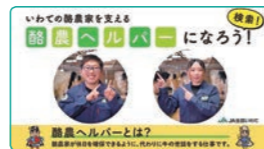
私たちは酪農ヘルパー(15秒)

令和4年度は「岩手県酪農ヘルパー人材確保定着化推進事業」の実施最終年度です。引き続き事業を活用し、人材確保、定着化、広域活動等の課題解決に向けて取り組んでいきましょう!