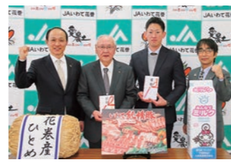
令和4年2月24日 花巻東高等学校野球部への牛乳贈呈式

スポーツ大会出場校等への牛乳提供やキャンペーン等を行い、『いわての牛乳』の認知度向上と消費拡大を図ります。