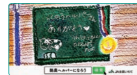
酪農ヘルパーさんありがとう篇(30秒)